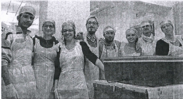
Nuovi locali L'ingresso, la sala refettorio e il gruppo di volontari

prio tempo non solo per servire a tavola, ma per far funzionare il centro di ascolto, distribuire il vestiario e coordinare il servizio docce.