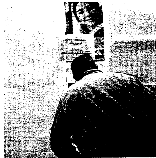
PERPLESSITÀ Il palazzo di Piazza Giovanni Paolo II e la mancata inaugurazione del 24 ottobre